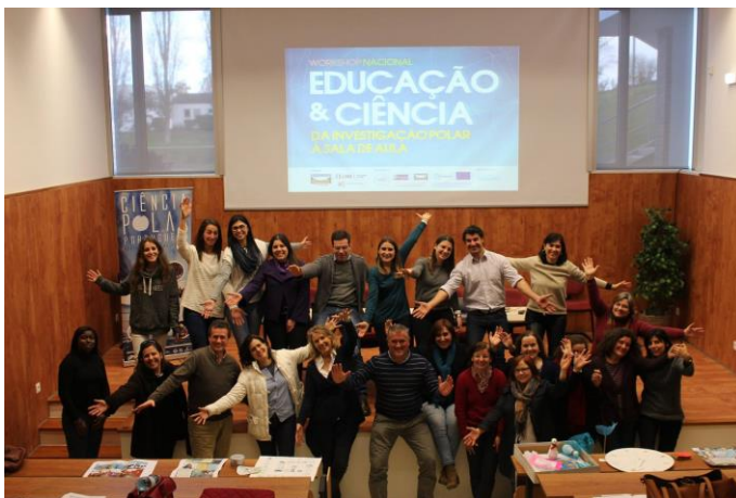
Participantes da workshop Educação e Ciência, dirigido a educadores (e cientistas polares) interessados em ciência e educação polares (Lisboa)